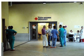
Nuova influenza, gli italiani poco preoccupati di una pandemia Doxa: in 19 Paesi solo 28% teme virus A/H1N1; l'Europa lo snobba